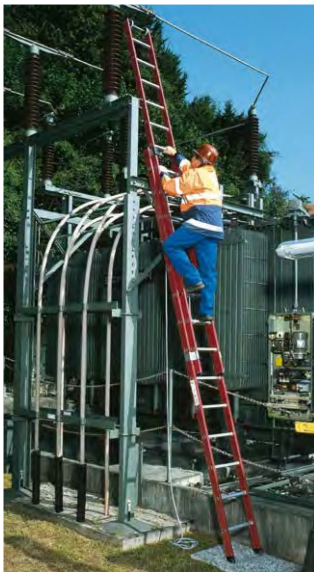
Артикул № 35214, крепление лестницы с помощью крючков