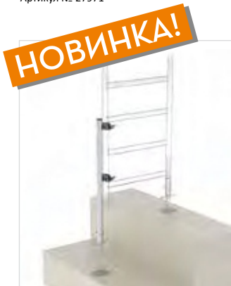
Артикул № 70506