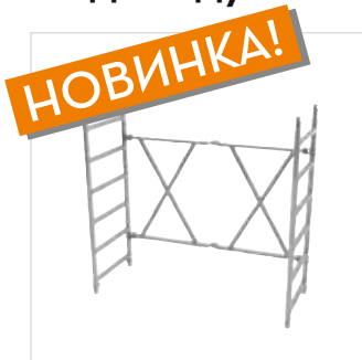
Артикул № 27971