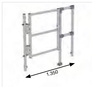
Артикул № 70508

Для лесов шириной: 1350 мм. Вес: 10,6 кг.