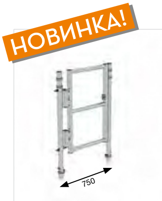
Артикул № 70507