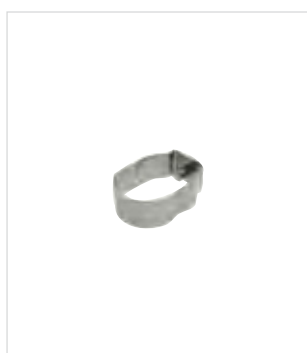
Артикул № 19413