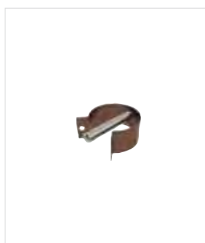
Артикул № 19430