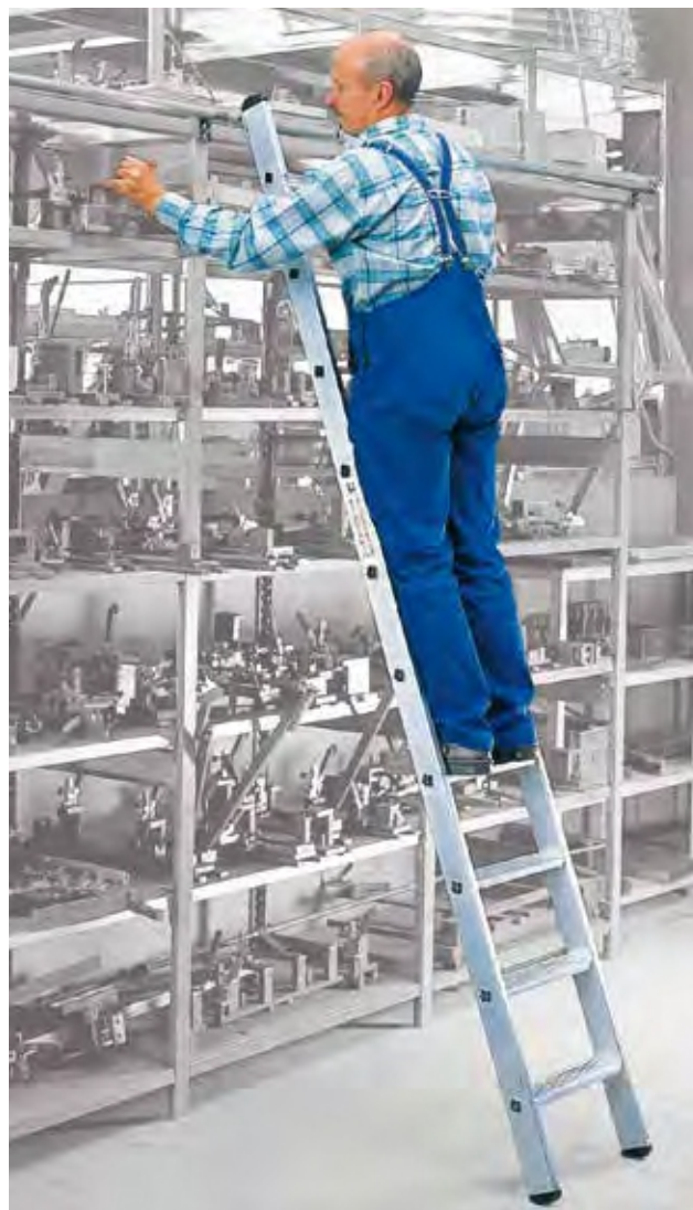
Артикул № 41310

Мы также производим лестницы по вашим размерам. Лестницы произведенные по индивидуальному заказу возврату не подлежат.