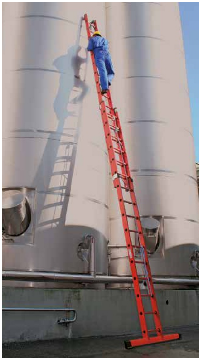
Артикул № 36616