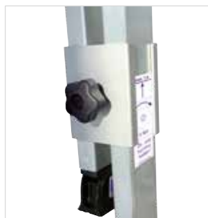
Эргономичные звездобразные ручки приятны на ощупь для надежной фиксации удлинителя боковой стойки.