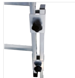
Прочная и надежная направляющая для удлинения боковой стойки.