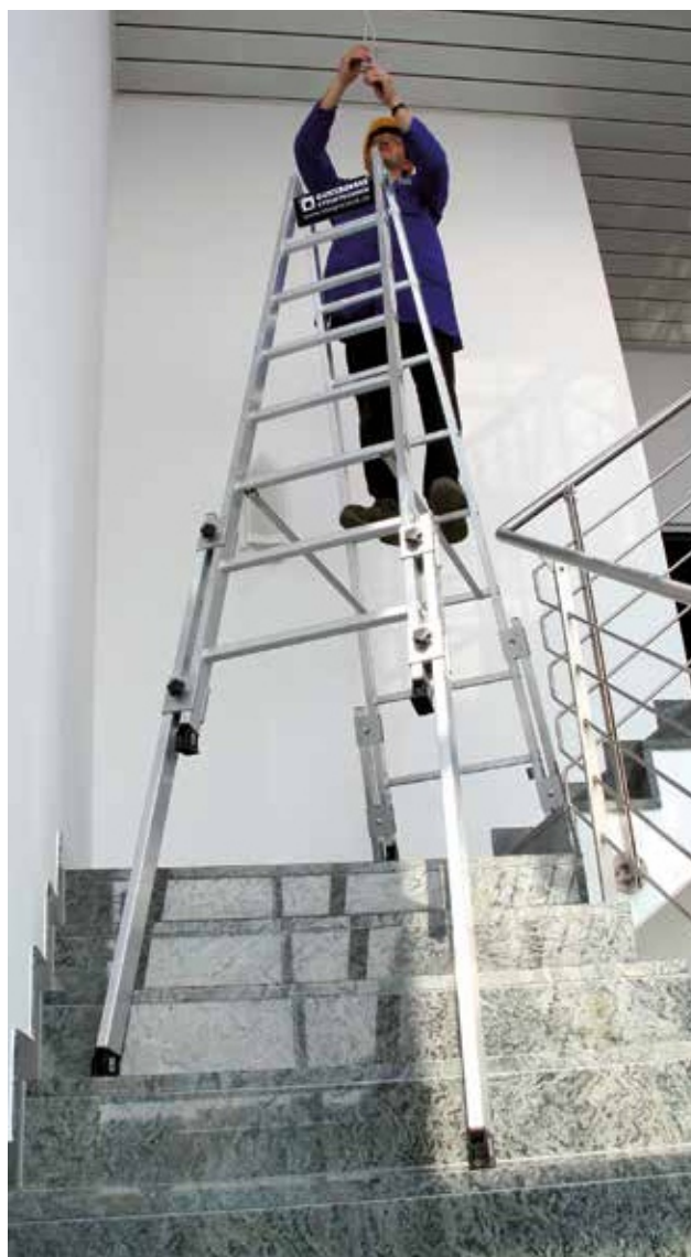
Артикул № 33516