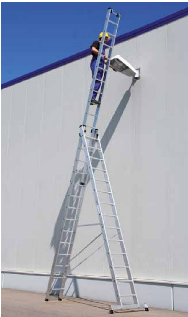
Артикул № 33314