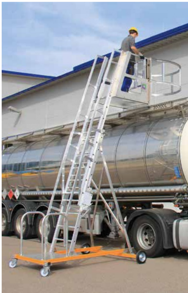
Артикул № 301304 и 301306

Принимает во внимание требования к прочности и стабильности материалов в соответствии с европейским стандартом DIN EN 131-7