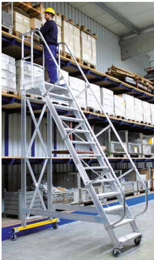
Артикул № 300733

Стандартная версия выполнена из рифленого алюминия. Другие покрываются за дополнительную плату (см. стр. 146).