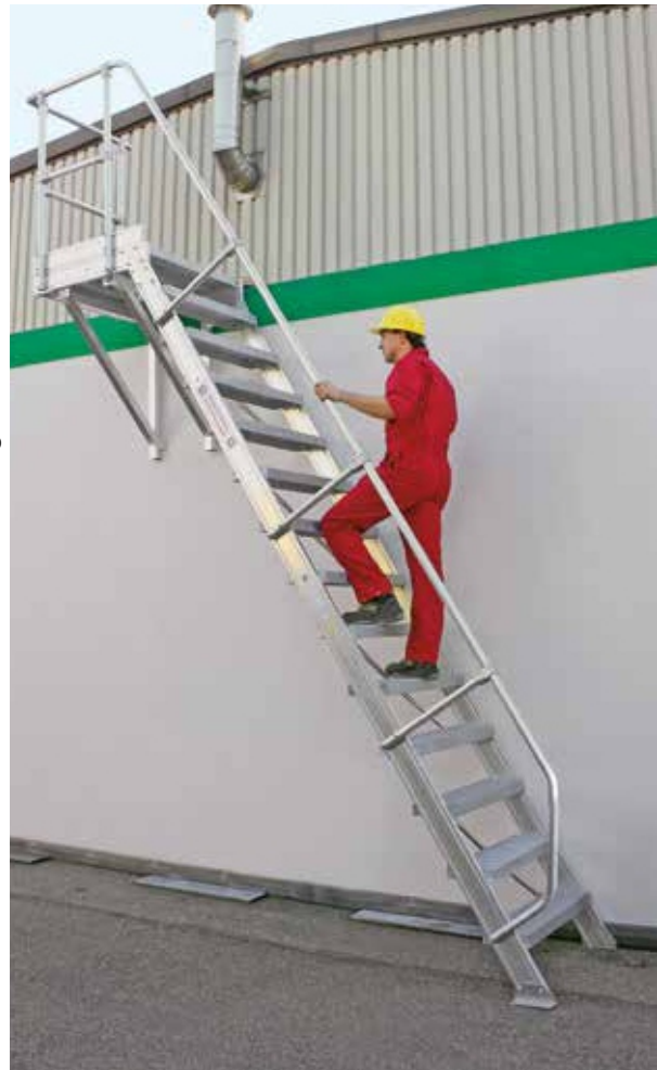
Трап с платформой, дополнительно с кронштейнами и передними перилами

Стандартная версия выполнена из рифленого алюминия. Другие покрываются за дополнительную плату (см. стр. 146).