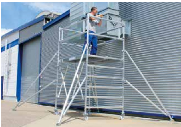
Артикул № 115200 с выносными опорами