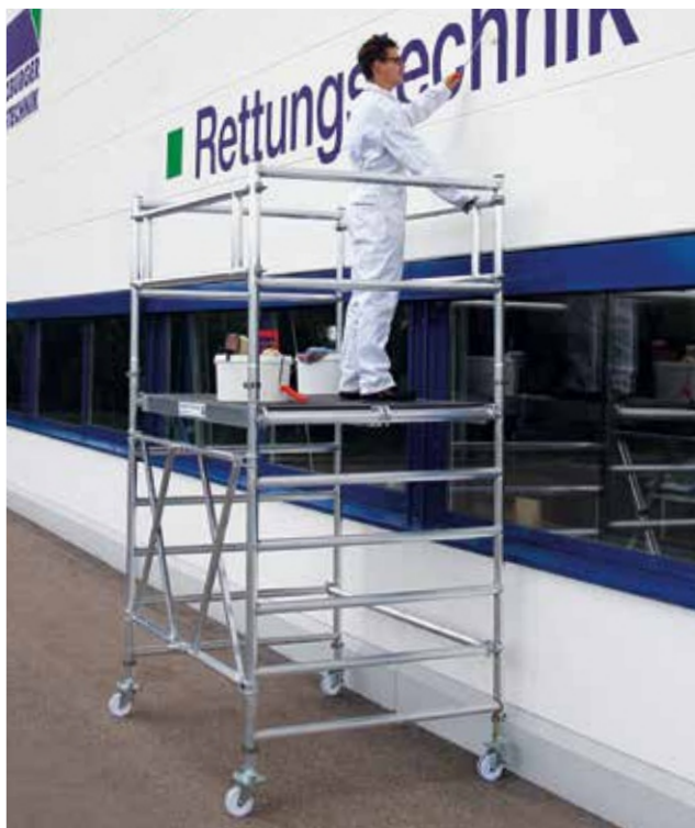
Артикул № 115200