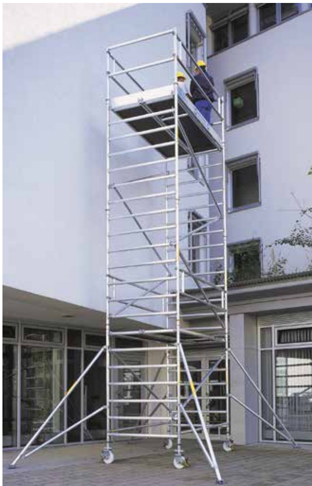
Артикул № 168635