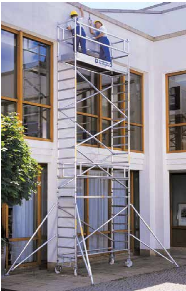
Артикул № 178635