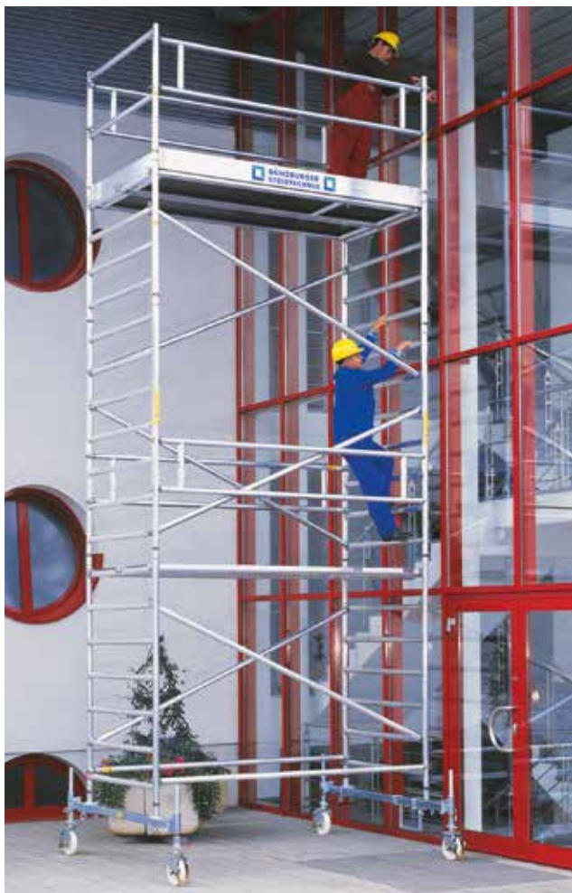
Артикул № 174535