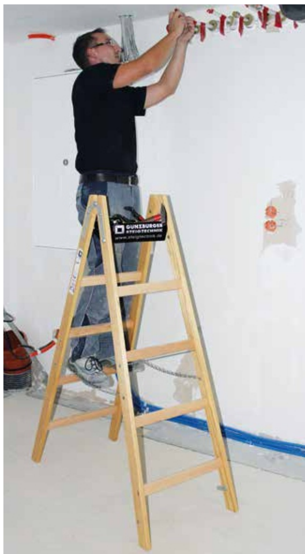
Артикул № 33210