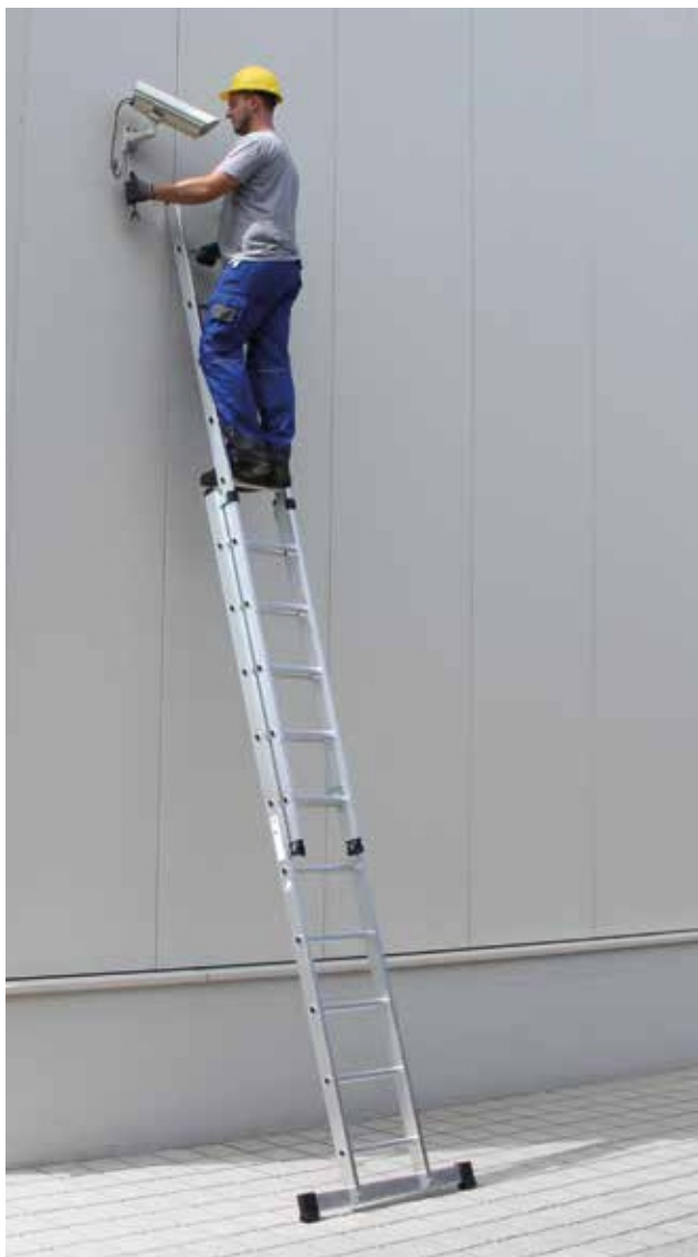
Артикул № 20810